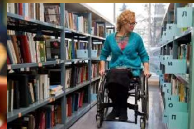
Библиотеки, приспособленные для инвалидов колясок