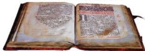
А это первая книга Московского печатного двора.

В Древней Руси книги писали на березовой коре – бересте. Знаки на кору наносили костяным стерженьком с ушком вверху, сквозь которое продевалась тесемка. Стерженек подвешивали к поясу.