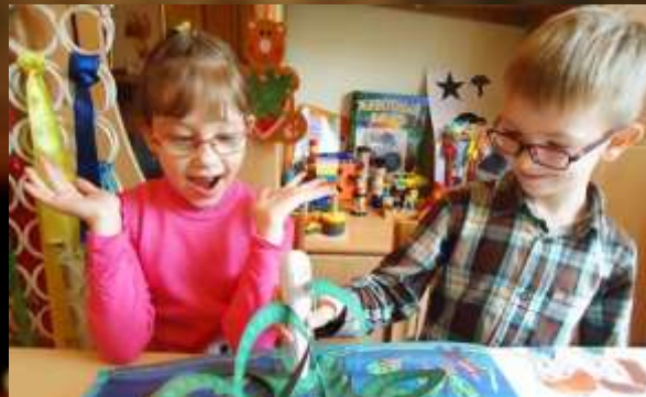
ТАКТИЛЬНЫЕ КНИГИ-для слабовидящих детей