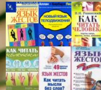
ЯЗЫК ЖЕСТОВ-для слабослышащих детей